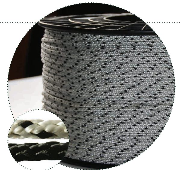
Réf. HB200, les 200 m (blanc) Réf. HB500, les 500 m (blanc) Réf. HB200N, les 200 m (noir)