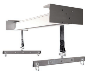
ÉLÉVATEUR ÉLECTRIQUE Réf. SOLEE