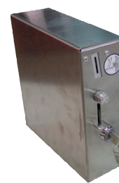
MONNAYEUR Réf. SOLMON