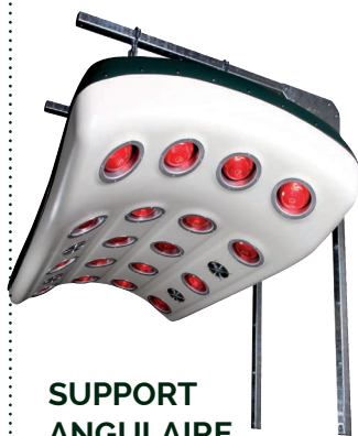
SUPPORT ANGULAIRE Réf. SOLSUP