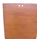
SÉPARATION EN BOIS Réf. HFSEP