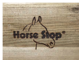
Marquage à chaud