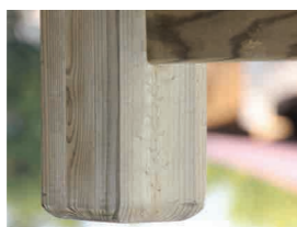
Pied de portail chanfreiné