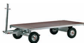
Réf. HPCHAR, le chariot