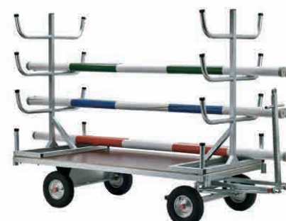
Réf. HPMO, l'ensemble